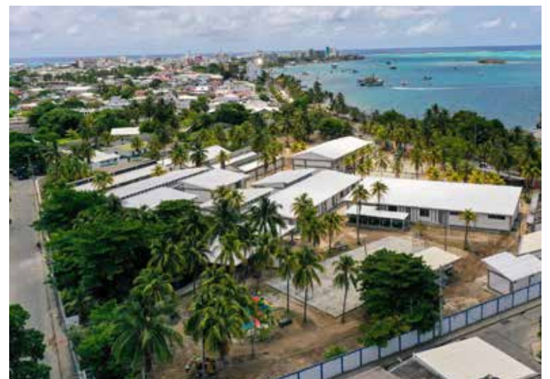
VISTA AÉREA DE la Institución Educativa Técnico Industrial, en San Andrés Islas.

El establecimiento tuvo que ser totalmente reconstruido por el mal estado en que estaba. En 2.939 metros cuadrados se habilitaron 16 aulas de básica y media, tres aulas mejoradas, tres aulas polivalentes, una biblioteca, un aula de bilingüismo, un laboratorio integrado, un aula de tecnología, innovación