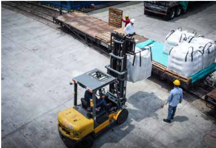
LAS EMPRESAS QUE operan en el país están multiplicando los contratos de carga por vía férrea.

Desde que comenzó la Administración del Presidente Petro se está trabajando en todo el país para hacer más activos los siguientes tramos, en especial para el transporte de carga: Corredor Férreo Central: La Dorada – Chiriguaná – Santa Marta, Trenes del Pacífico, Región Metropolitana de Bogotá – Belencito y los denominados Trenes del Cata-tumbo.■