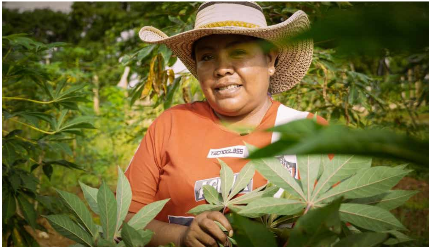
LOS HABITANTES DE las zonas rurales del país reciben del Gobierno ayuda financiera y técnica para el desarrollo de actividades agrícolas.

De norte a sur, funcionarios de la ADR recorrieron los departamentos de Sucre, Córdoba, Antioquia, Chocó, Valle del Cauca y Meta, entregando insumos, herramientas, ganado, embarcaciones e infraestructura a los campesinos. En Sucre y Córdoba, se entregaron cinco proyectos valorados en 31.000 millones de pesos, para favorecer 1.433 familias de pescadores, productores