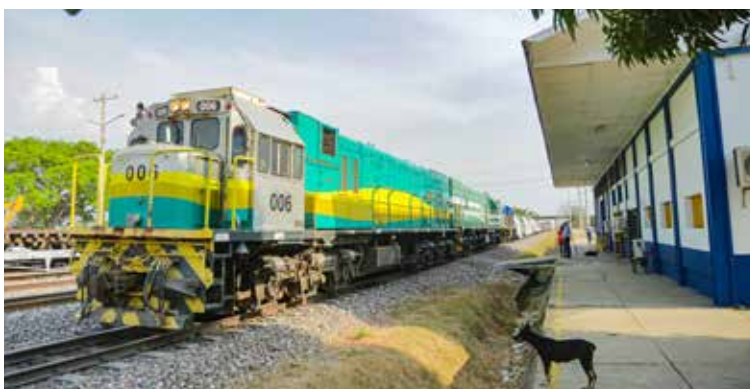
POR TODO EL país crece el transporte férreo y vuelve a verse el fascinante paso del tren.

Red Férrea del Pacífico: La Agencia Nacional de Infraestructura avanza en la conexión del puerto de Buenaventura con el Corredor Férreo Central mediante la estructuración de la prefactibilidad y un análisis multicriterio para determinar la mejor opción en la reactivación de la Red Férrea del Pacífico. Esto, por medio de un contrato interadministrativo con la Financiera de Desarrollo Nacional (FDN), por un valor de 24.997 millones de pesos. La consultoría ha evaluado las mejores conexiones posibles: a través del departamento de Antioquia (Ferrocarri de Antioquia), del Eje Cafetero (Conexión férrea PLEC) y del departamento del Tolima.■