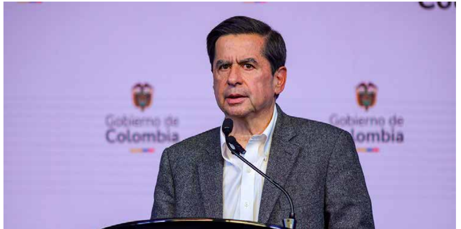
MINISTRO DESIGNADO DEL Interior, Juan Fernando Cristo.

Llegó Juan Fernando Cristo al Ministerio del Interior y explicó que su tarea inmediata es “abrir un diálogo con todos los sectores del país: amigos del Gobierno, oposición, altas Cortes, Congreso, organizaciones sociales y comunitarias, sindicatos, gremios y empresarios”.