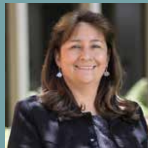
Ángela M. Buitrago ministra de Justicia.