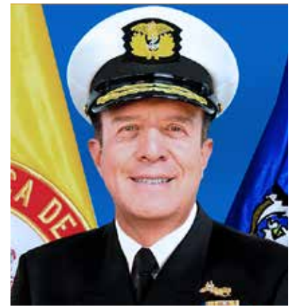
ALMIRANTE FRANCISCO HERNANDO Cubides Granados.

vida”. El Presidente concluyó: “Sin acción climática se extingue la humanidad, entonces de qué sirven los dineros y los intereses en la Reserva Federal o en el FMI o en los fondos de capital de Wall Street, si no hay humanidad”.