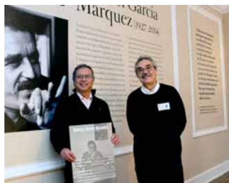
SALA GABO EN la Casa de Nariño.

El espacio está incluido en el recorrido guiado que se ofrece al público que visita la casa presidencial. ■