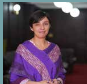
Martha V. Carvajalino ministra de Agricultura.