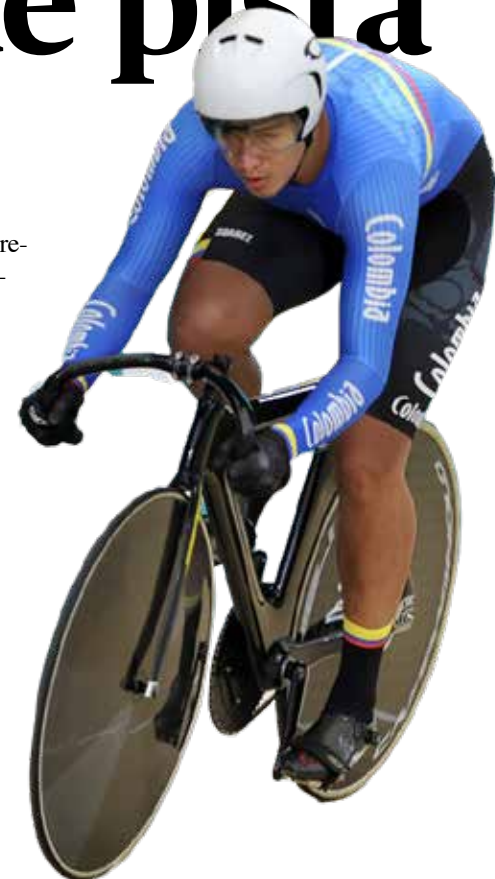
EL CICLISTA KEVIN Quintero, vigente campeón mundial en la modalidad de keirin.

Lo mejor es que su camino está abonado para seguir dejando una huella imborrable en la historia del ciclismo colombiano. ■