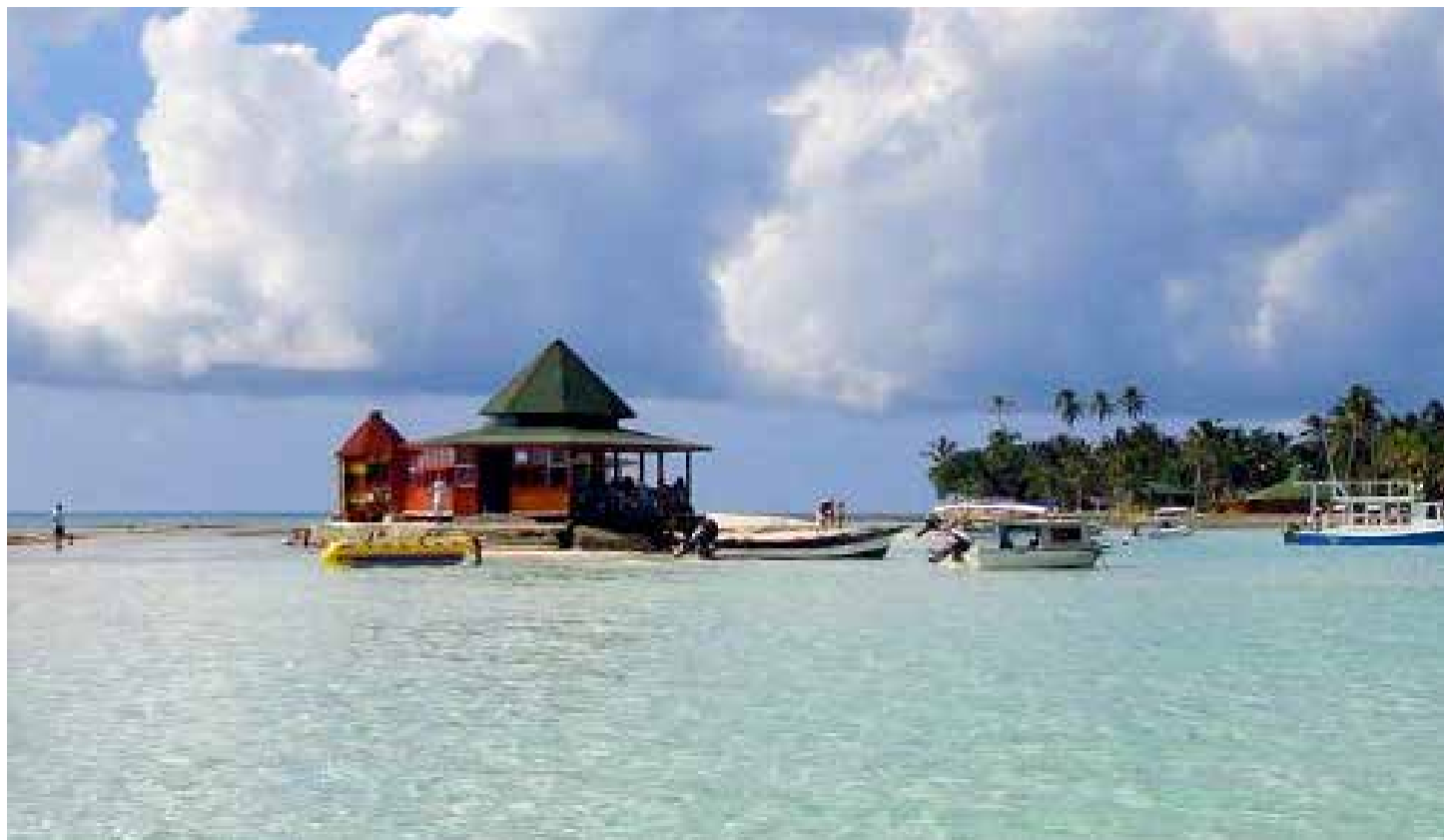
PAISAJE DEL ARCHIPIÉLAGO de San Andrés, Providencia y Santa Catalina.

El ministro de Comercio, Industria y Turismo, Luis Carlos Reyes, dijo que estos premios “nos ayudarán en una de las metas fundamentales del Gobierno del Cambio que es potenciar el turismo y convertirlo en un motor del crecimiento económico. Este logro refleja nuestro compromiso por un futuro económico sostenible”.