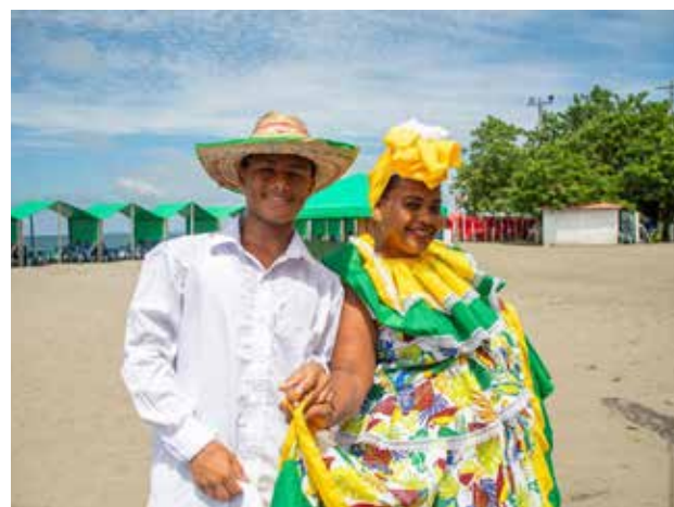
LA CULTURA Y la amabilidad de la gente, hacen de Colombia un país atractivo para miles de turistas del mundo.

“La prosperidad del sector turístico se construye entre todos, y cada vez se reafirma más la confianza de los empresarios e inversionistas en un destino como Colombia”, dijo el ministro Luis Carlos Reyes.